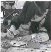
オリジナルレザートレイづくり