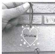
プラ板☆名前キーホルダー