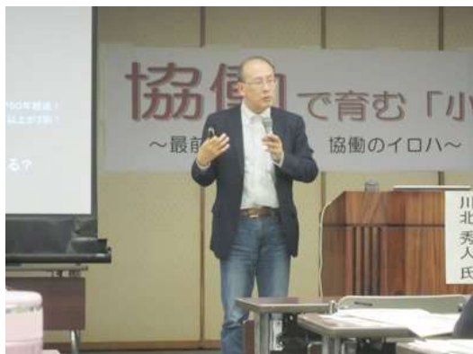
▲全国の協働事例をもとに、協働の必要性を説く川北氏。

2月22日（金）、小牧市役所東庁舎5階大会議室で、『協働で育む「小牧の絆」』と題して、市民まちづくりセミナーを開催しました（市協働推進課と当ネットワークとの共催）。講師は全国の自治体で、協働によるまちづくりをテーマに、市職員とNPOとの合同研修を数多く手がける、IIHOE〔人と組織と地球のための国際研究所〕代表の川北秀人氏。この日も会場には市職員と市民合わせて約150人が参加し、今求められる協働によるまちづくりの必要性について一緒に学びました。