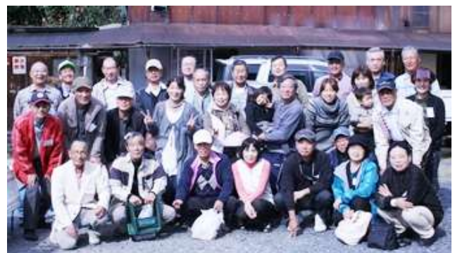
▲秋晴れの下、33名が参加して交流を深めました。

11月4日（土）、農縁をサポートいただいているグリーンライフ小牧さんの事務所をお借りして、収穫祭として芋煮会を開催しました。大きな2つの鍋に、たくさんの具材を入れコトコト煮込むこと3時間。美味しくできあがった芋煮と持ち寄ったお料理をいただきながら、しばし交流を深めました。また、グリーンライフ小牧さんから、子どもさんと、まるまる太ったカブトムシの幼虫のプレゼントがあり、子ども達は大はしゃぎでした。