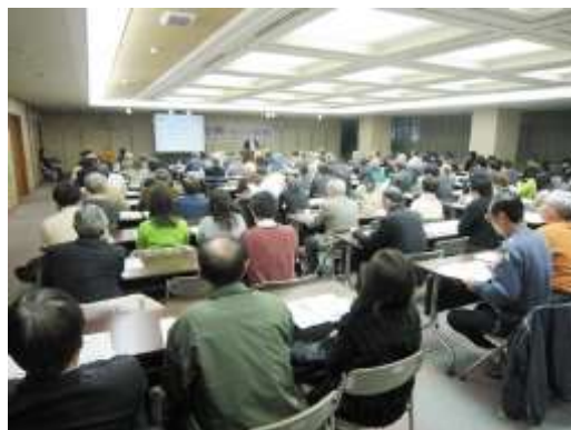
▲参加者の多さからも協働への関心の高さがうかがえました。