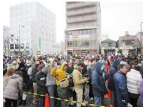
▲販売開始前、会場を埋めつくす人・人・人。

凍てつく寒さの中、早朝から手伝ってくださったスタッフのみなさん、お疲れ様でした！