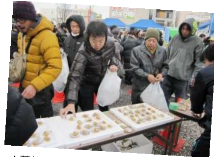
▲落部漁協のみなさんによる、ゆでたホタテの試食コーナー。