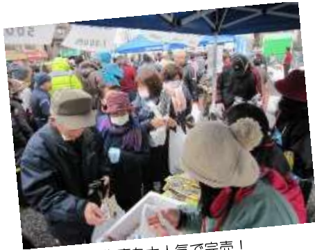
▲八雲町物産も大人気で完売！