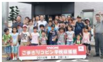
▲ 収穫祭の記念写真

トマトの栽培を通して、食への関心や感謝の気持ちを育もうと、池之内の明るい農縁の一部で「こまきリコピン学校」を開催し、約40人の親子連れが参加しました。5月の開校式から8月の収穫祭までの間、葉巻病による被害などもあり、自然の厳しさも学んだ貴重な経験となりました。収穫祭ではトマトを使った調理にもトライし、みんなで美味しくいただきました。