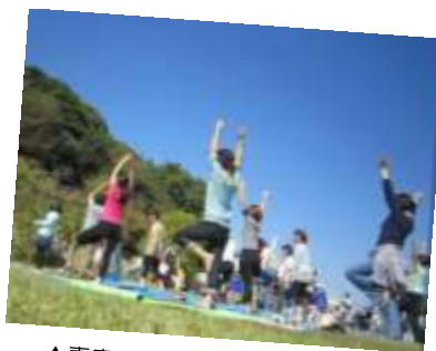
▲青空の下、城ヨガでリフレッシュ！