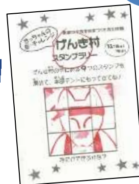
▲きっちゃんの絵柄を集めるスタンプラリー。1日目は746名、2日目526名のお子さんが参加しました