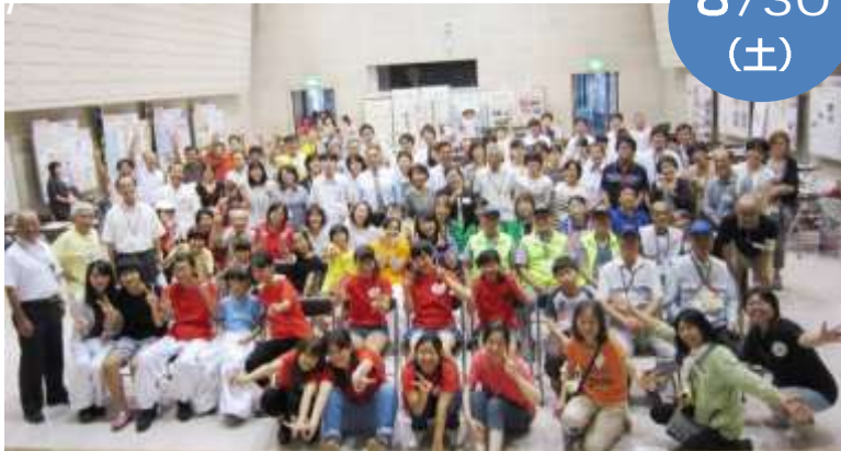
▲オープニング前、出展団体のみなさんとスタッフ全員で

出展団体同士の輪が育つ中、一般参加者にもその輪を広げることが、今後の課題となっています。