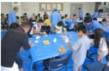
◀ 製作所内で行った竹とんぼの制作風景

参加の小学生30人は、竹の会や名誘社員の方の指導のもと竹とんぼ作りを体験し、その後ヘリコプターが飛ぶ仕組みについて、名誘社員の方よりレクチャーを受けました。