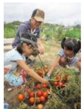
真っ赤に熟れたトマトを収穫する参加者 ▶