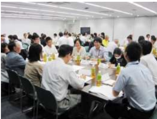
▲市民活動団体と各課職員が同じテーブルを囲んで自由にディスカッションしました

先日開催した「市民と行政の協働交流会」、今年も多数のご参加をいただき、誠に有難うございました。私がファシリテーターを務めたチームは、小牧駅前のまちづくりの話題で大いに盛り上がった一方で、「えっ、あなたも桃花台に住んでの?」といった話でも会話が弾み、笑いが絶えない楽しい時間となりました。