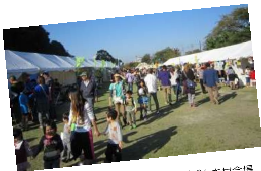
▲芝生の上、体験ブースのテントが並びげんき村会場

また、パフォーマンスエリアでは、げんき村恒例の出し物に加え、チアダンスや城ヨガなどの体験型パフォーマンスもあり、多くの参加者でにぎわいました。