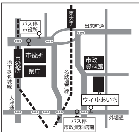
あいち交流プラザ（ウィルあいち）

名古屋市東区上野杉町1番地 地下鉄名城線「市役所」駅2番出口より東へ 徒歩約10分 TEL: 052-961-8100