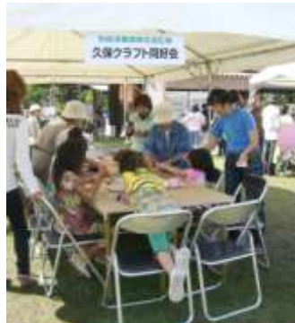
久保クラフト同好会