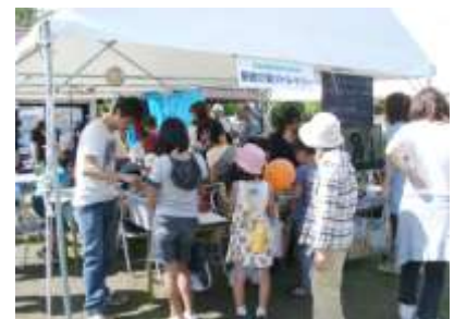
野遊び塾リトル・トリー