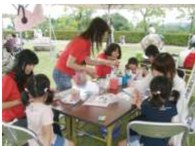
まちの放送局つくろう隊