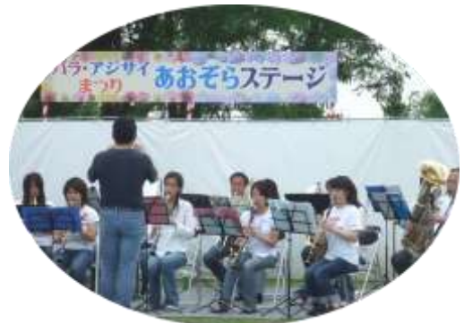
小牧市民吹奏楽団

初日は雨が降りだす場面もあり、ステージに出演した団体にとってハラハラした一日となりましたが、みなさんステキな演奏やパフォーマンスで会場を盛り上げてくださいました。