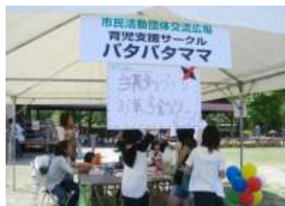
育児支援サークルパタパタママ