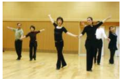
講師の手ほどきを受けながら、メンバーも生徒のみなさん。