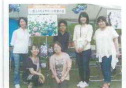
▲一色コスモスサポート学習の会