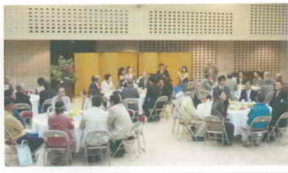
▲中部フィルハーモニー交響楽団の弦楽四重奏を聴きながら、円卓を囲んで親睦を深めた懇親会

こまき市民活動ネットワークが設立して9年目、法人格を取得して7年目となり、活動の幅も多岐に渡り過渡期に入りました。今後も会員のみなさまと共に、さらなる発展を目指して精進して参りたいと思います。