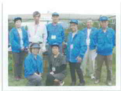
▲小牧防災リーダー会