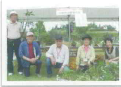
▲小牧市山野草の会