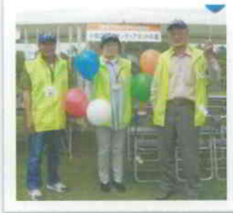
▲小牧災害ボランティアネットの会