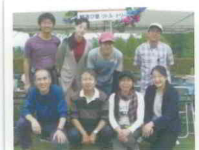
▲野遊び塾トル・トリー