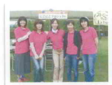
▲にこにこプロジェクト