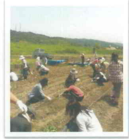
▲暑い中、園長先生とお母さん達で一生懸命苗を植えました。みんなで作業すると楽しいですね！

明るい農縁では、わずかですが空き区画があり（6月25日現在）、利用者を募集しています。詳細はネットワーク事務局までお問い合わせください。