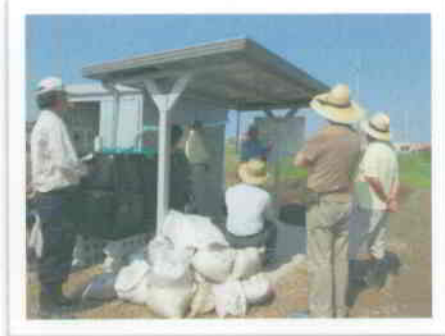
▲6月8日には、農業アドバイザーによる「害虫害鳥対策」についての講習会を開きました。

池之内市民菜園でも、多少空き区画があり（6月25日現在）、利用者を募集しています。興味のある方は事務局までお問い合わせください。