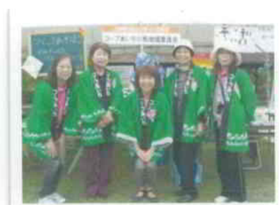
▲コープあいち小牧地域委員会