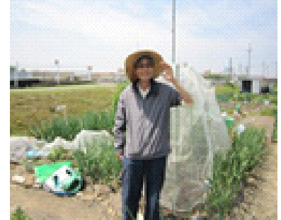
▲カメラに向かって素敵なポーズ！