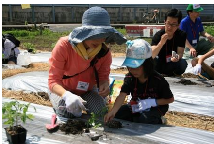
▲苗にかからないよう慎重に水やりをする参加者

今年で3年目を迎える「こまきリコピン学校」は、カゴメのトマト「凧々子」の栽培を通して、子どもたちに育てる面白さや収穫する喜びを体感してもらい、食への感謝の気持ちを養うことを目的に実施しています。この日行われた開校式では20名の参加児童へ入校証授与の後、カゴメ職員指導のもと、親子で仲良く「凧々子」の苗の植え付けを行いました。