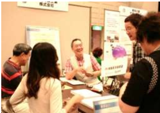
▲各ブースを回って交流を深める参加団体。日頃、なかなか話をする機会のない団体同士がコミュニケーションを図れるのも、市民活動祭の魅力です。