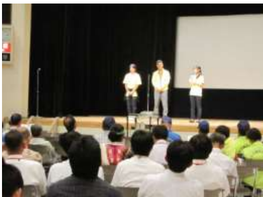
◀午後からの第2部では、市民ムービー『タカハマ物語』の制作に関った高浜市の方を迎え上映会を開催。その後の意見交換会では、映画づくりをきっかけにまちおこしに取り組む熱い想いを語っていただきました。