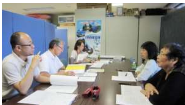
▲市民活動センターの会議スペースでミーティングを重ねるプロジェクトメンバー。