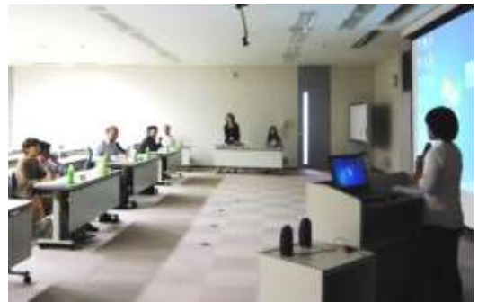
▲審査員から質問を受ける申請団体。

10月5日(土)東海ゴム工業本社大会議室において「TRI 夢・街・人づくり助成金 in 小牧・春日井」の公開審査会が行われ、書類による一次審査を通過した5団体が、公開プレゼンテーションに臨みました。